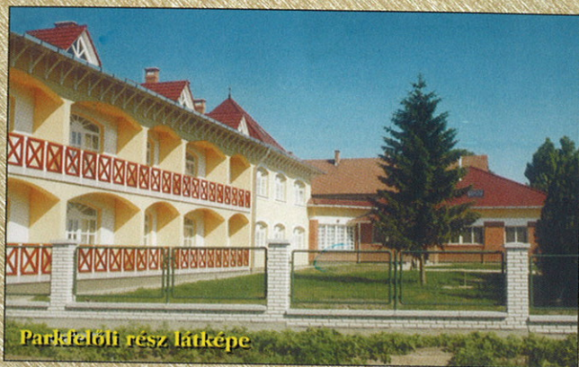
Parkfelőli rész látképe

MINDEN ÓFÖLDEÁKRA LÁTOGATÓNAK JÓ KIRÁNDULÁST KÍVÁNNAK E TÁJÉKOZTATÓ ALKOTÓI!