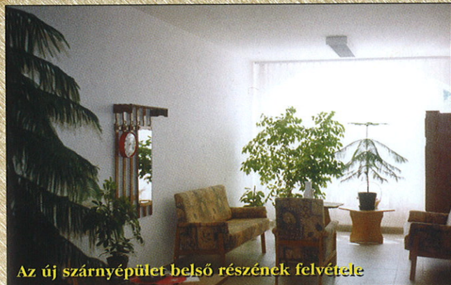
Az új szárnyépület belső részének felvétele

A z idősekről való gondoskodás színvonalának javítása érdekében új „hotel” jellegű résszel bővült az óföldségi Idősek Otthona. Több, mint 200 milliós beruházáshoz fogtak 1998 őszén, amelyet a Csongrád Megyei Közgyűlés finanszírozott. A kétszintes, lifttel ellátott épületet 2000 júniusában a lakók birtokba vehették.