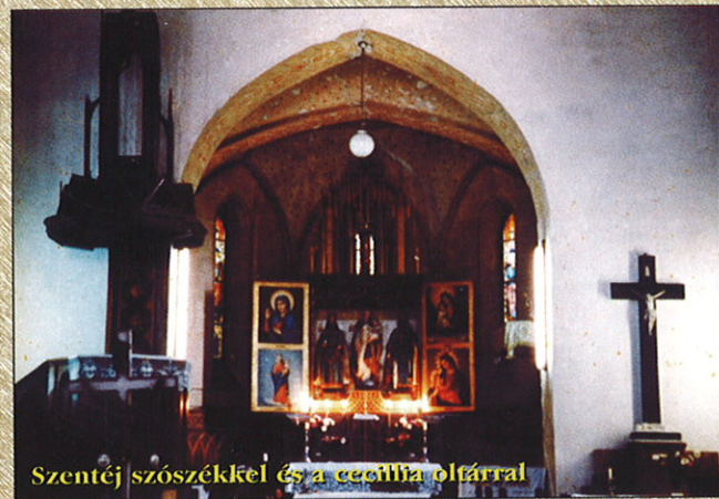
Szentjé szószékkel és a cecília oltárral