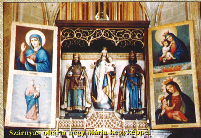
Szárnyas oltár a négy Mária kegyképpel