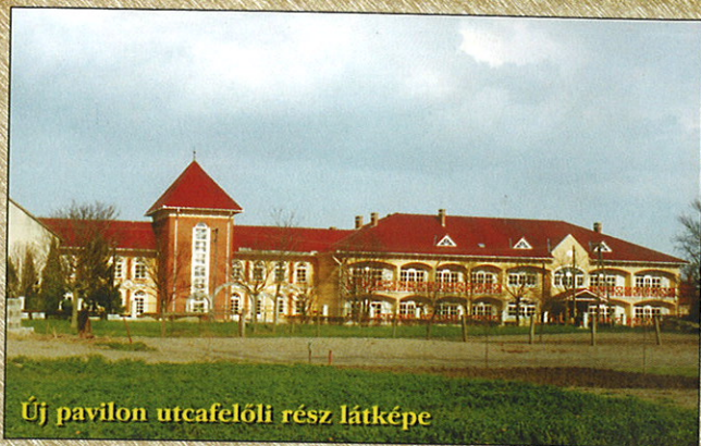
Új pavilon utcafelőli rész látképe